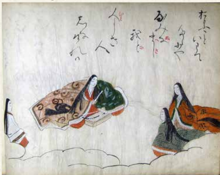
1 花鳥風月〔天正期以前〕

本展では、 御伽草子とよばれる公家や武士の物語、『竹取物語』『伊勢物語』などの平安物語、幸若舞曲や百人一首のカルタ等々、多種多様な奈良絵本コレクション(個人蔵)30点を一堂に展観! 第1回とは別の 新たな出品 で、時代を追って様々な原本を間近にご覧いただけます。