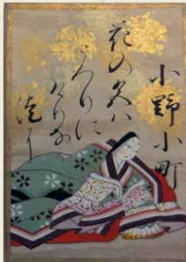
23 百人一首 カルタ [元禄頃]