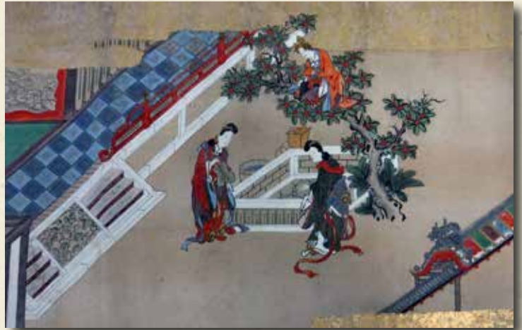
12 武家繁昌 [寛文頃]